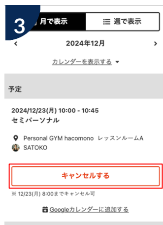
予約をキャンセルする場合は「キャンセルする」をタップ