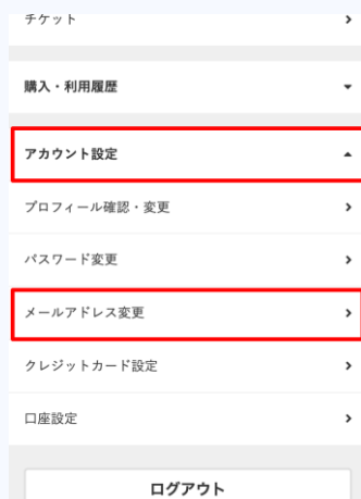
アカウント設定 > メールアドレス変更の順にタップ