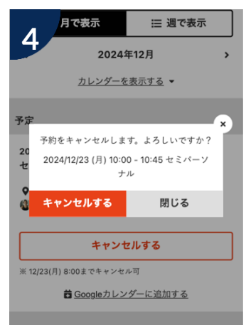
確認画面が表示されるので「キャンセルする」をタップ