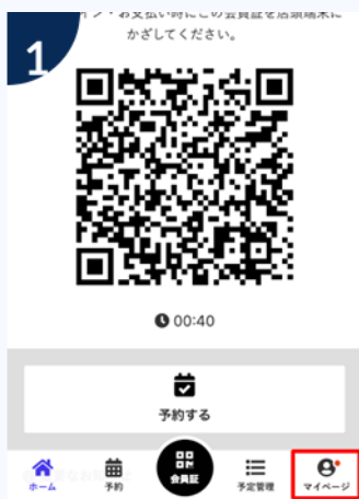
ページ下部の「マイページ」をタップ