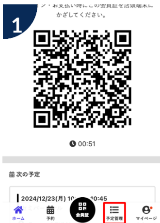
画面下部の「予約管理」をタップ