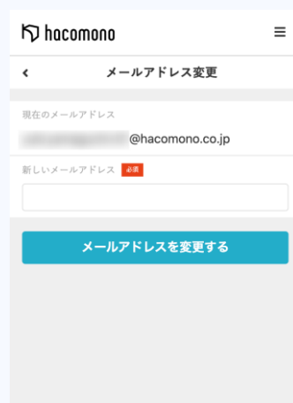
アドレスを入力し「メールアドレスを変更する」をタップ