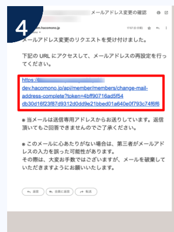
登録したアドレスに確認用メールが届きます。メール内のURLをタップ