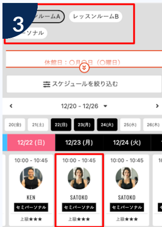
カレンダーを選択し予約するレッスンをタップ