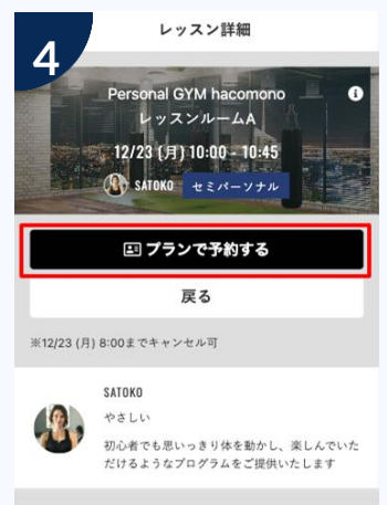
内容確認し予約してください