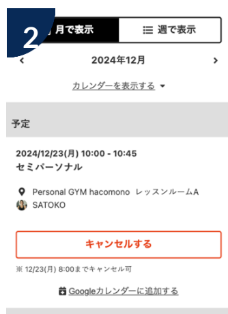
予約内容が表示されます